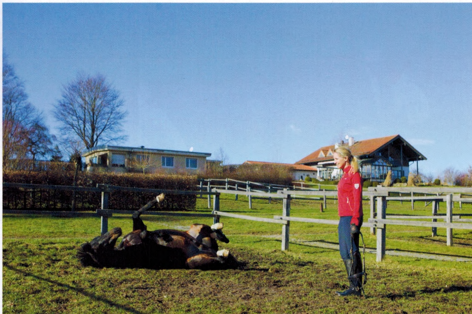
Heerlijk lekker rollen! Unee geniet volop op stal Aubenhausen.