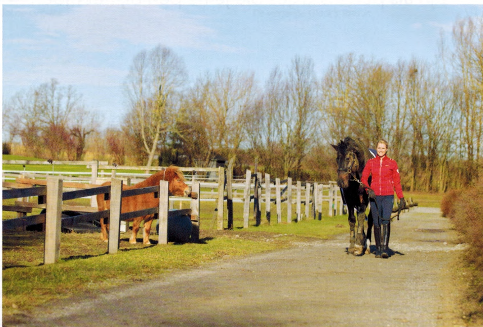
'Moddermonster' Unee kijkt nog even naar zijn vriendje, voordat hij onder de douche gaat.

ste reserve. In Duitsland is het heel moeilijk om in het dressuurteam te komen, maar het is uiteraard een van mijn doelen. Dit jaar hoopte ik me te plaatsen voor de wereldbekerfinale, en dat is gelukt! Verder liggen mijn ambities volledig bij het verbeteren van mijn rijden. Ik wil nieuwsgierig blijven en met open vizier kijken naar nieuwe dingen, kritisch naar mezelf durven zijn en reflecteren op de beste